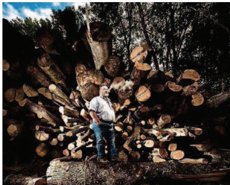
nb Une région vue à travers des portraits.

Remis le 20 septembre, ce prix Grand (photographie) salue le travail original de Régis Colombo. Il apporte une fresque intéressante de l'environnement naturel et de l'histoire sociale et culturelle de cette contrée. Un lieu appelé à se développer en fédérant les énergies des nombreuses communes qui en constituent l'armature.